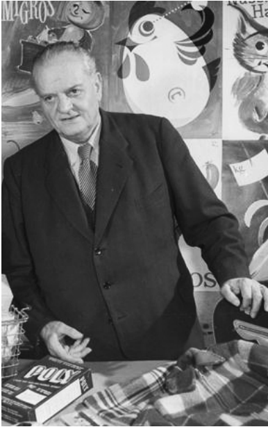
미그로 창시자 고틀리브 두트바일러 (1888~1962) 9)