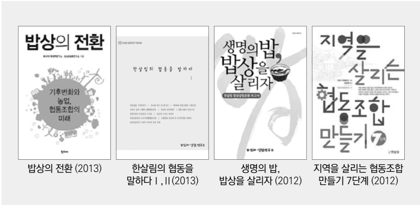
밥상의 전환 (2013)