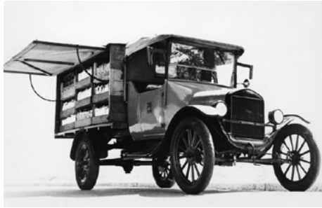
초기 미그로 공급차량(1925) 10)

Duttweiler의 개인 사업으로 시작됐다. 고틀리브는 스위스 산악지형 때문에 시장에 나가기 어려운 사람들을 대상으로 물품 공급을 시작했다. 1925년, 그는 공급차량 다섯 대와 직원 열여섯 명, 물품 여섯 가지로 미그로의 사